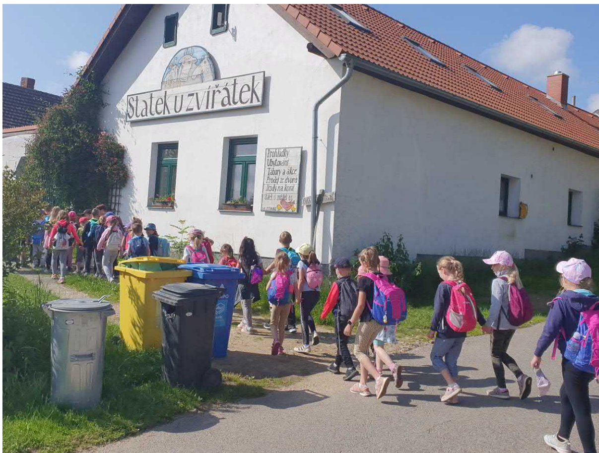
Školní výlet 1.B