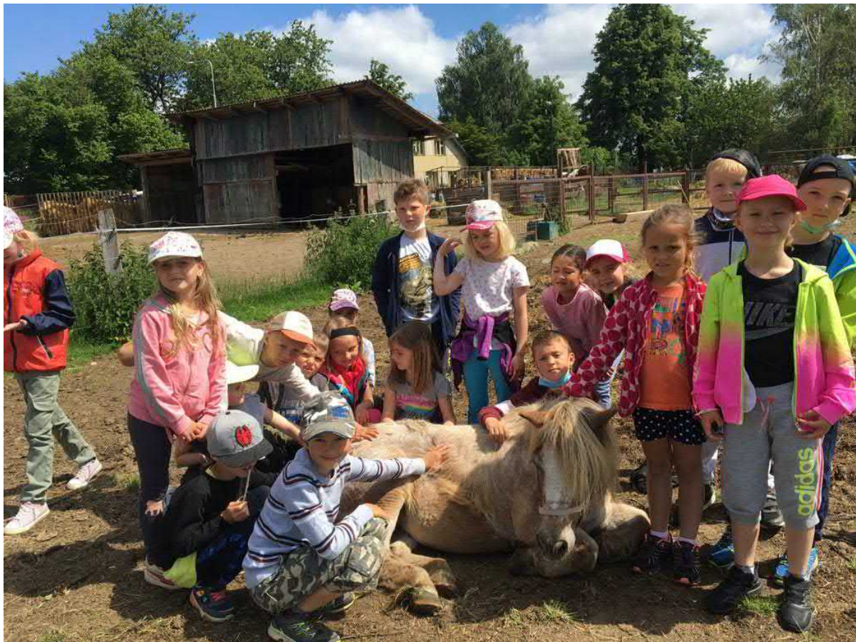
Školní výlet 1.A