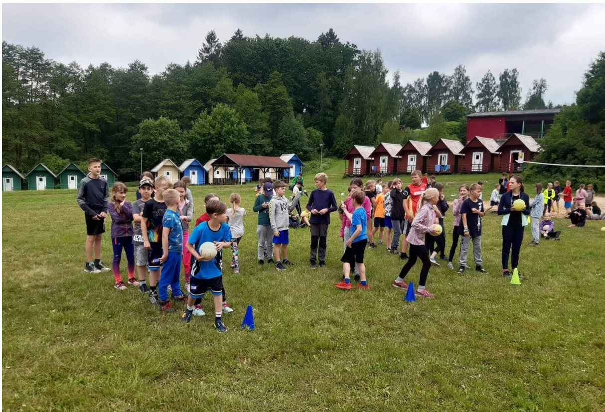
Soustředění plaveckých tříd Mladé Bříšťě