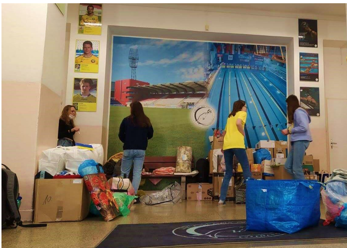
Sbírka pro Ukrajinu