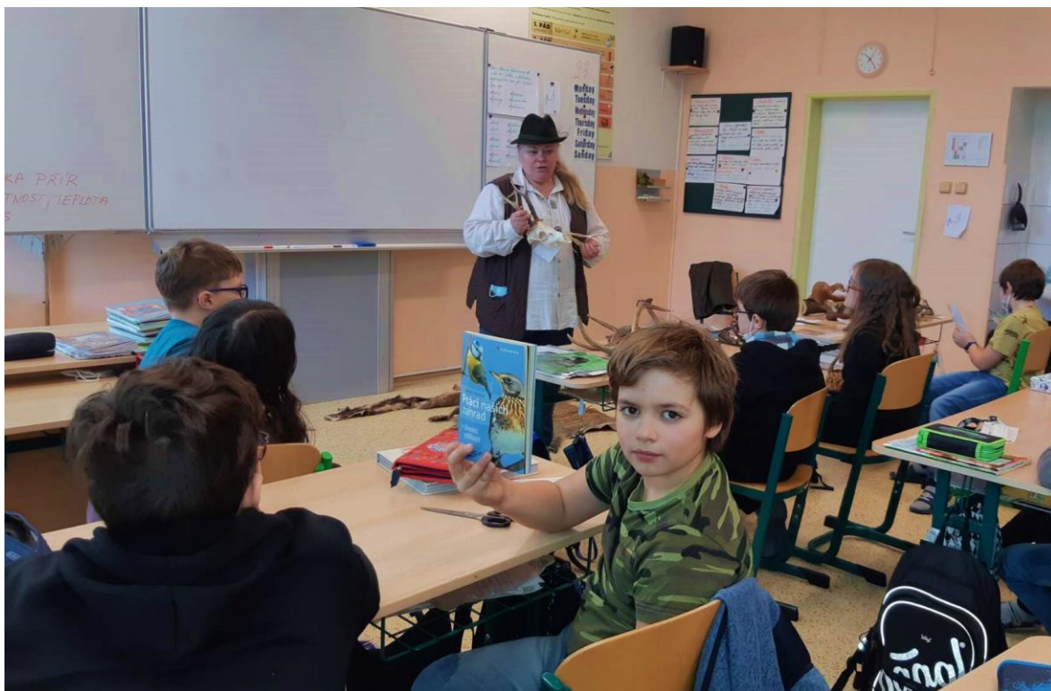
Beseda o přírodě