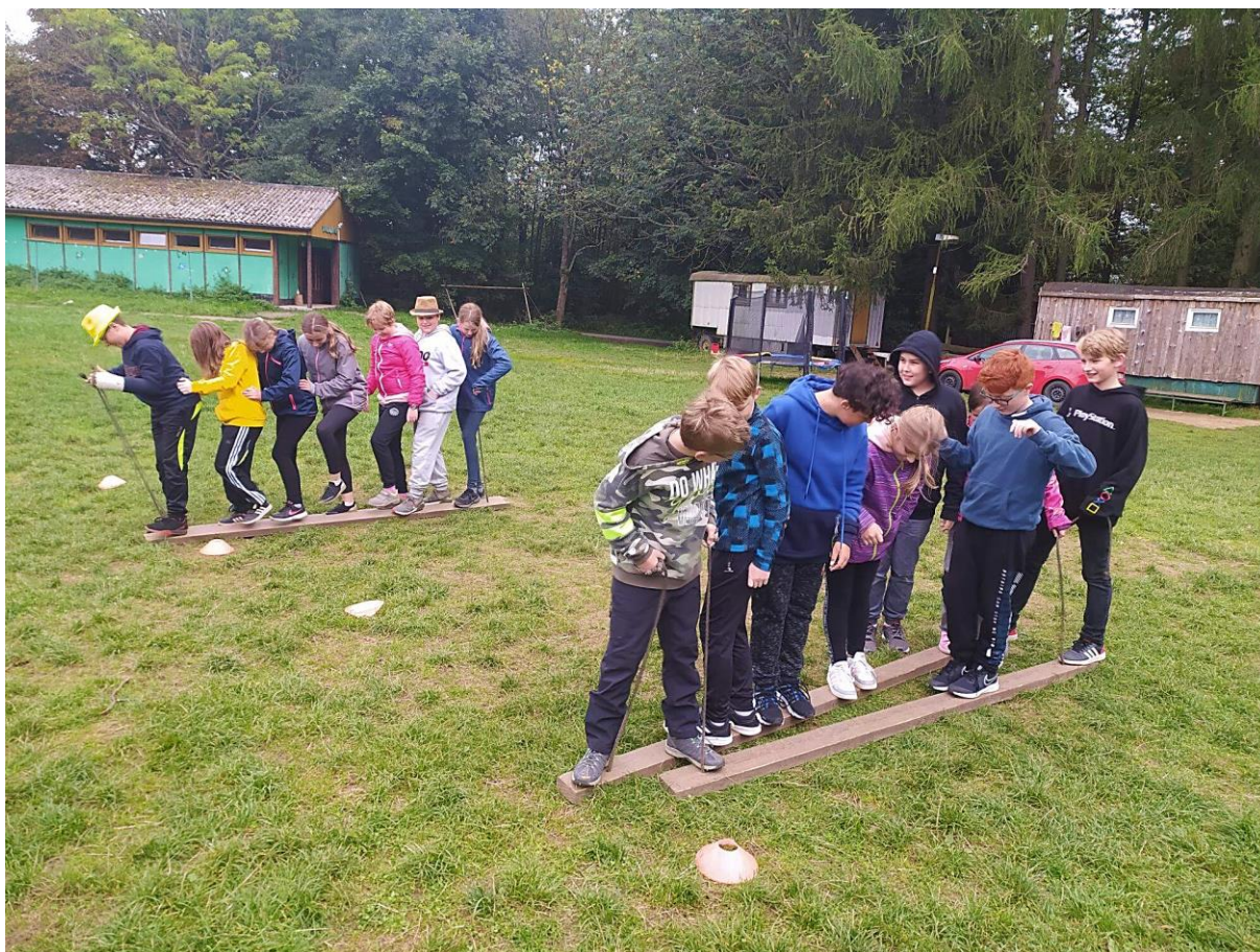
Adaptační kurz Beruška 6.D