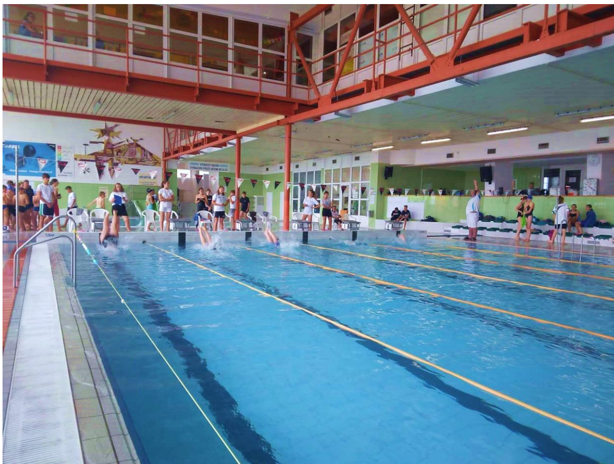
Školní plavecké závody