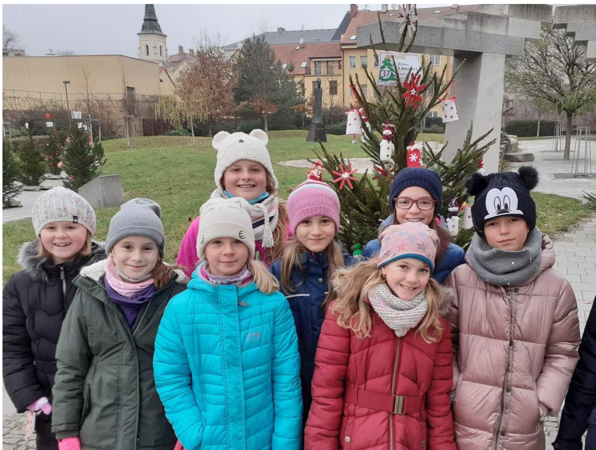
Zdobení vánočního stroměčku