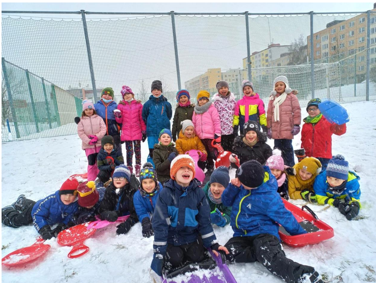
Zimní radovánky 1.C a 2.A