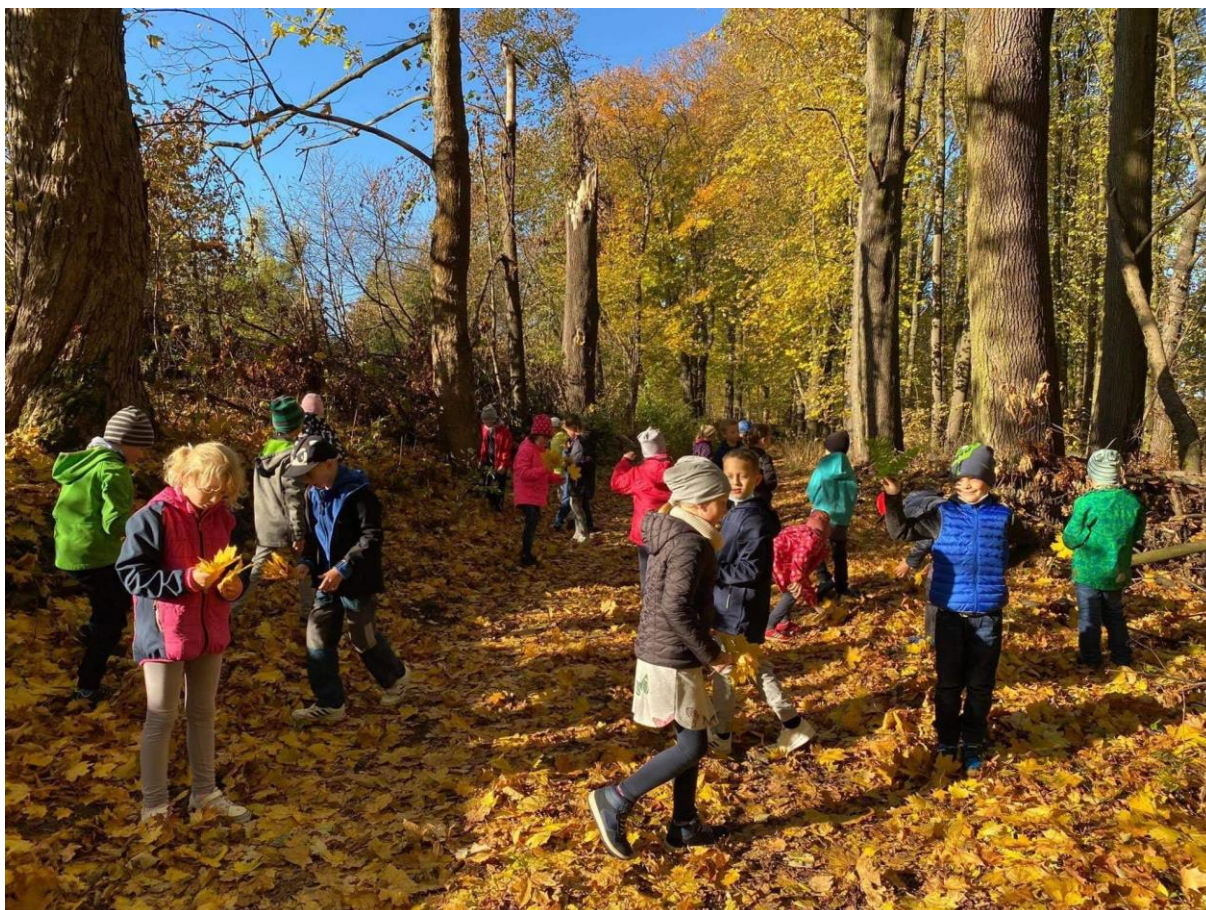
Den stromů 2.D