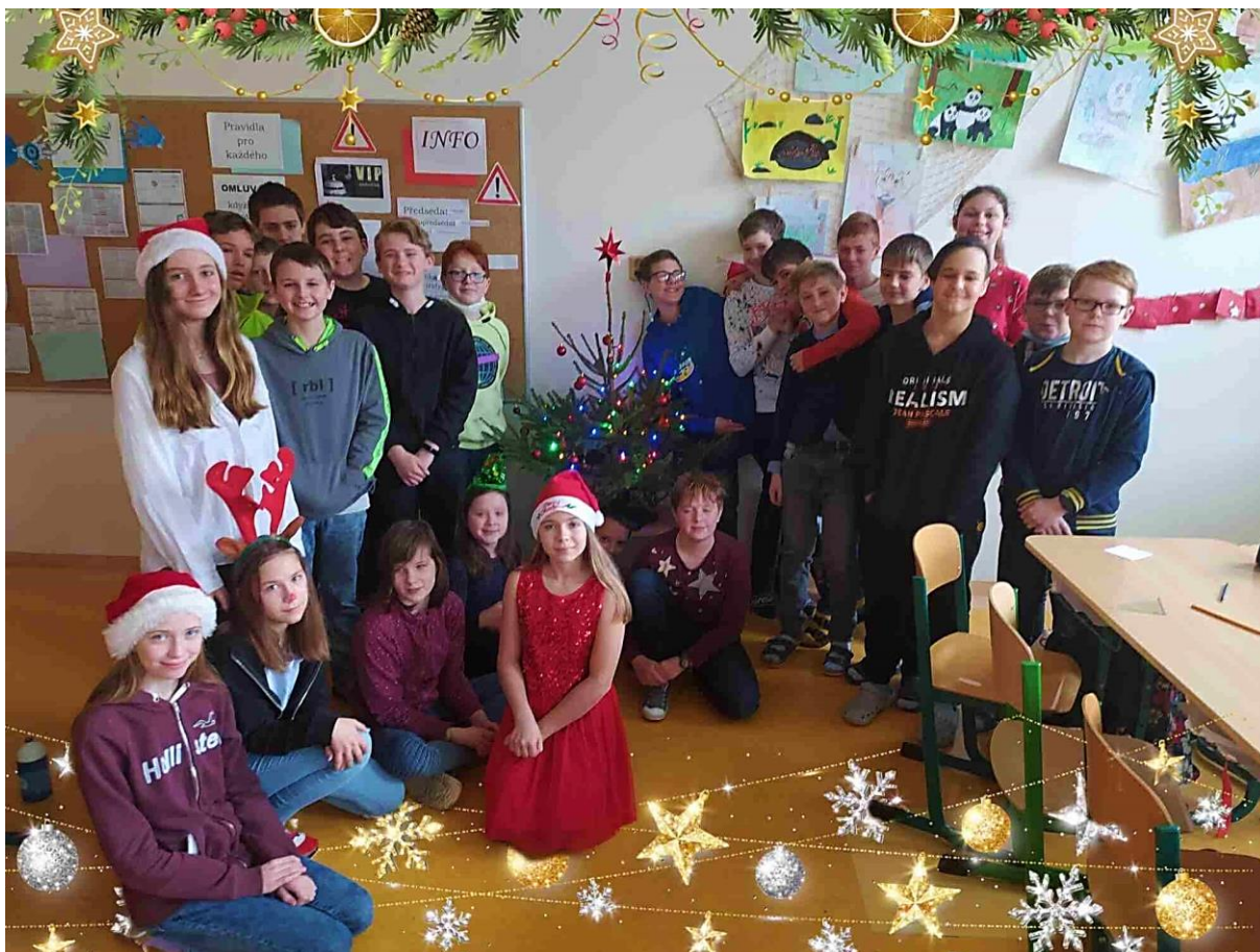
Vánoční besídka 6.D