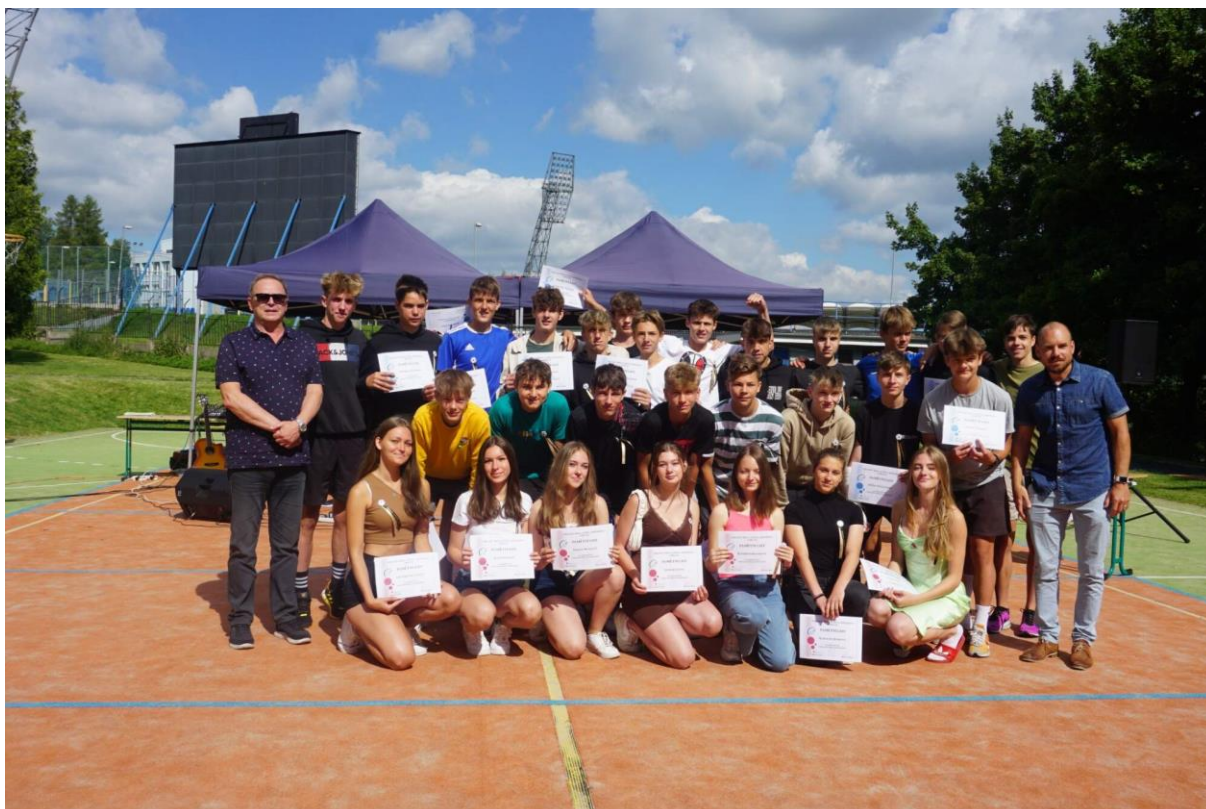
Rozlučka 9. tříd