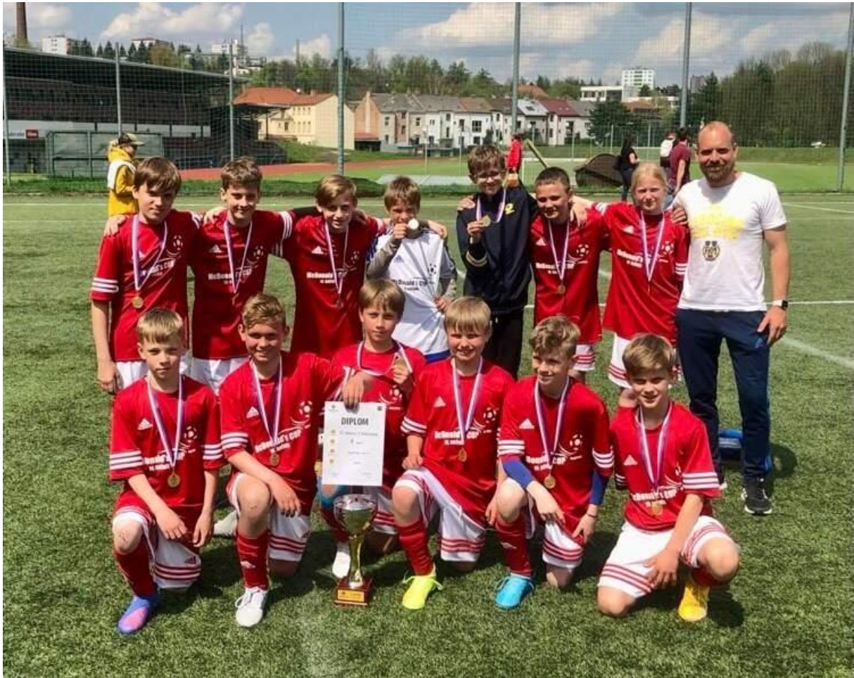
Postup na republikové finále McDonald's Cupu