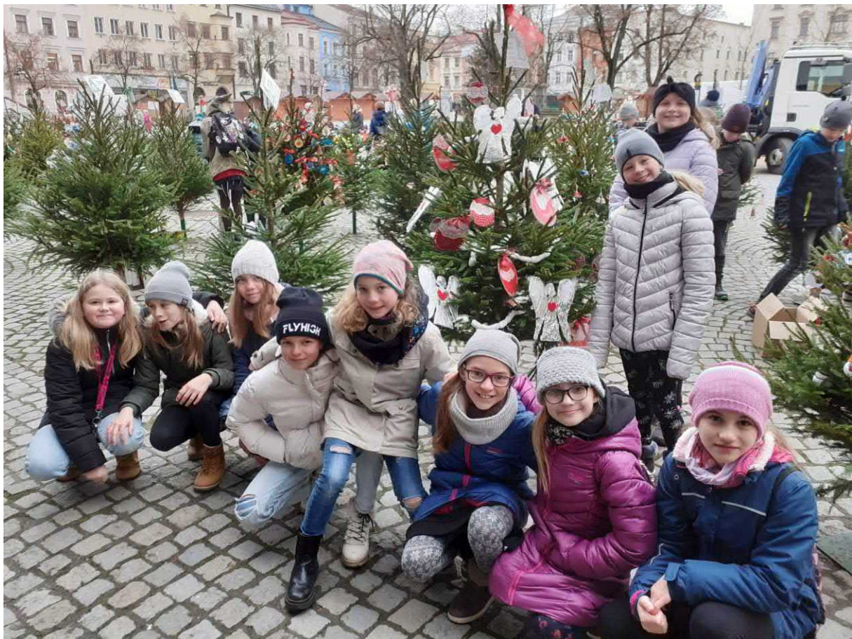
Zdobení stromečku na náměstí