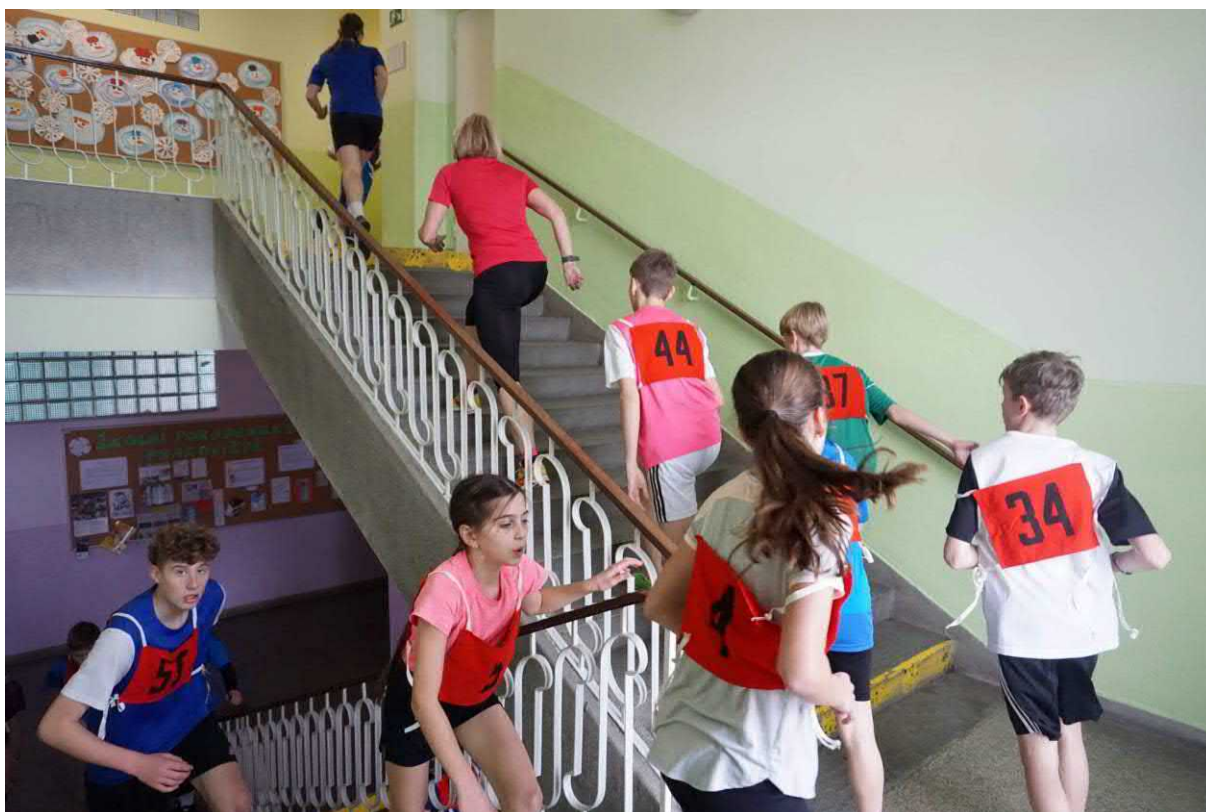
Výstup na Sněžku