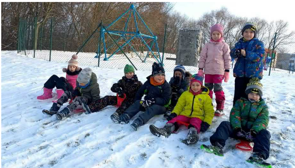
Zimní radovánky 1.A