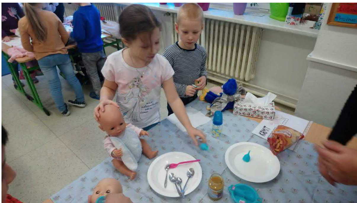
Den s miminky – projektový den 1.C