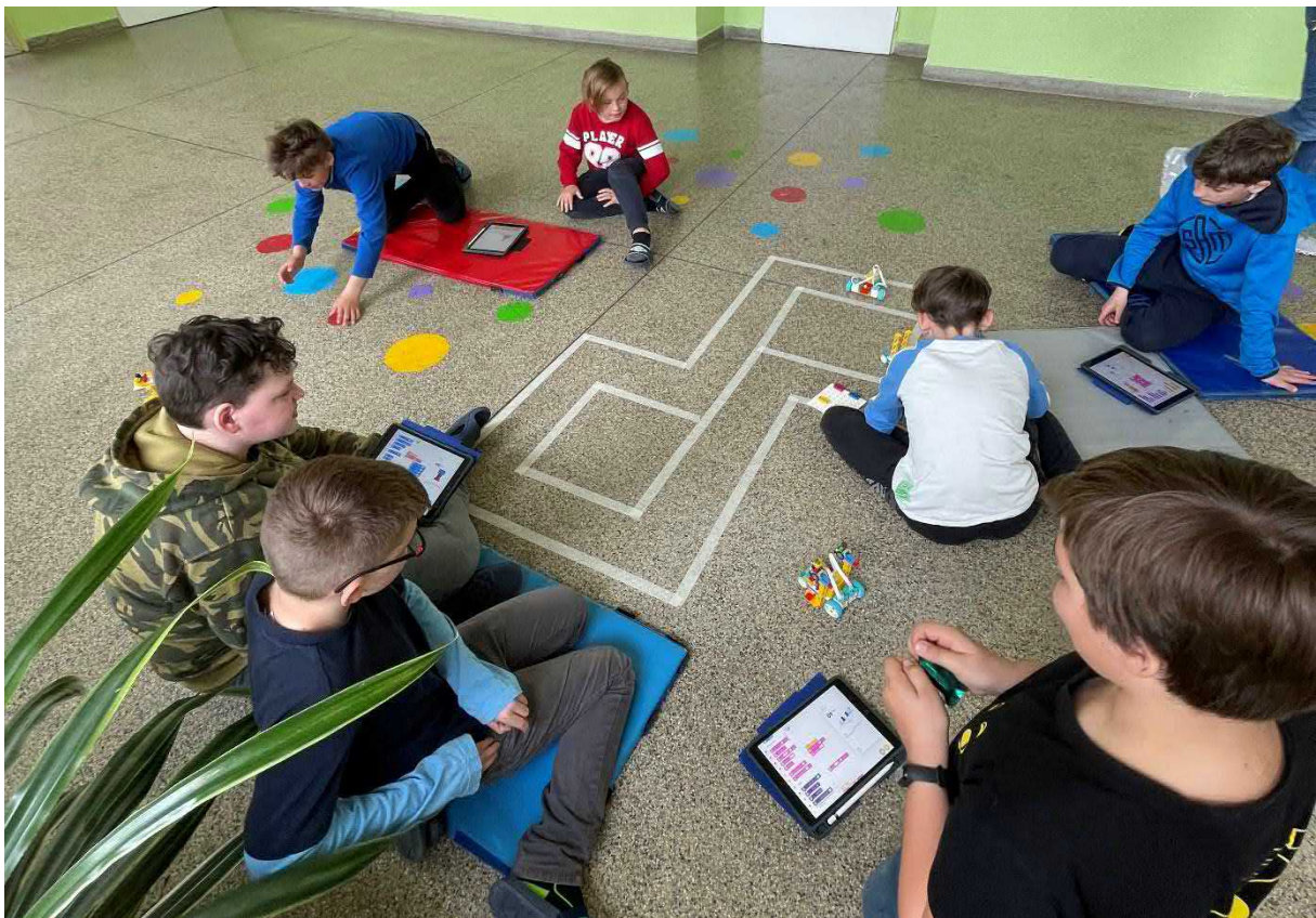
Hodina informatiky 5.B