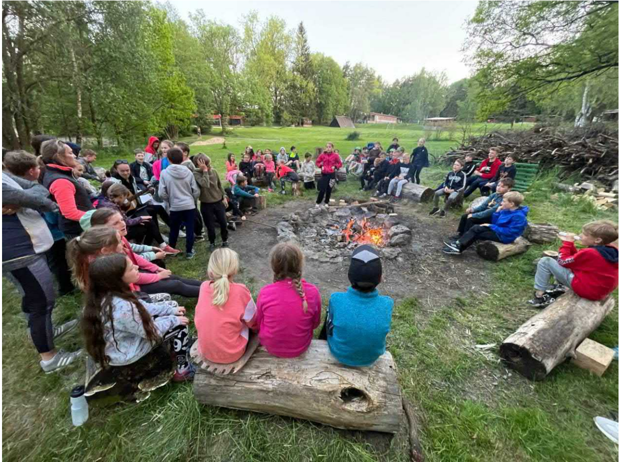
Soustředění plaveckých tříd Kalich