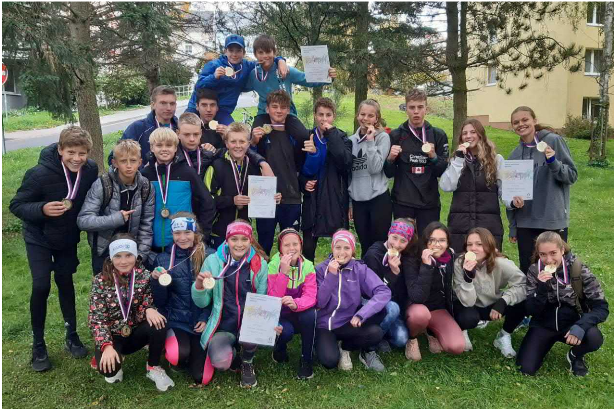
Okresní kolo v přespolním běhu