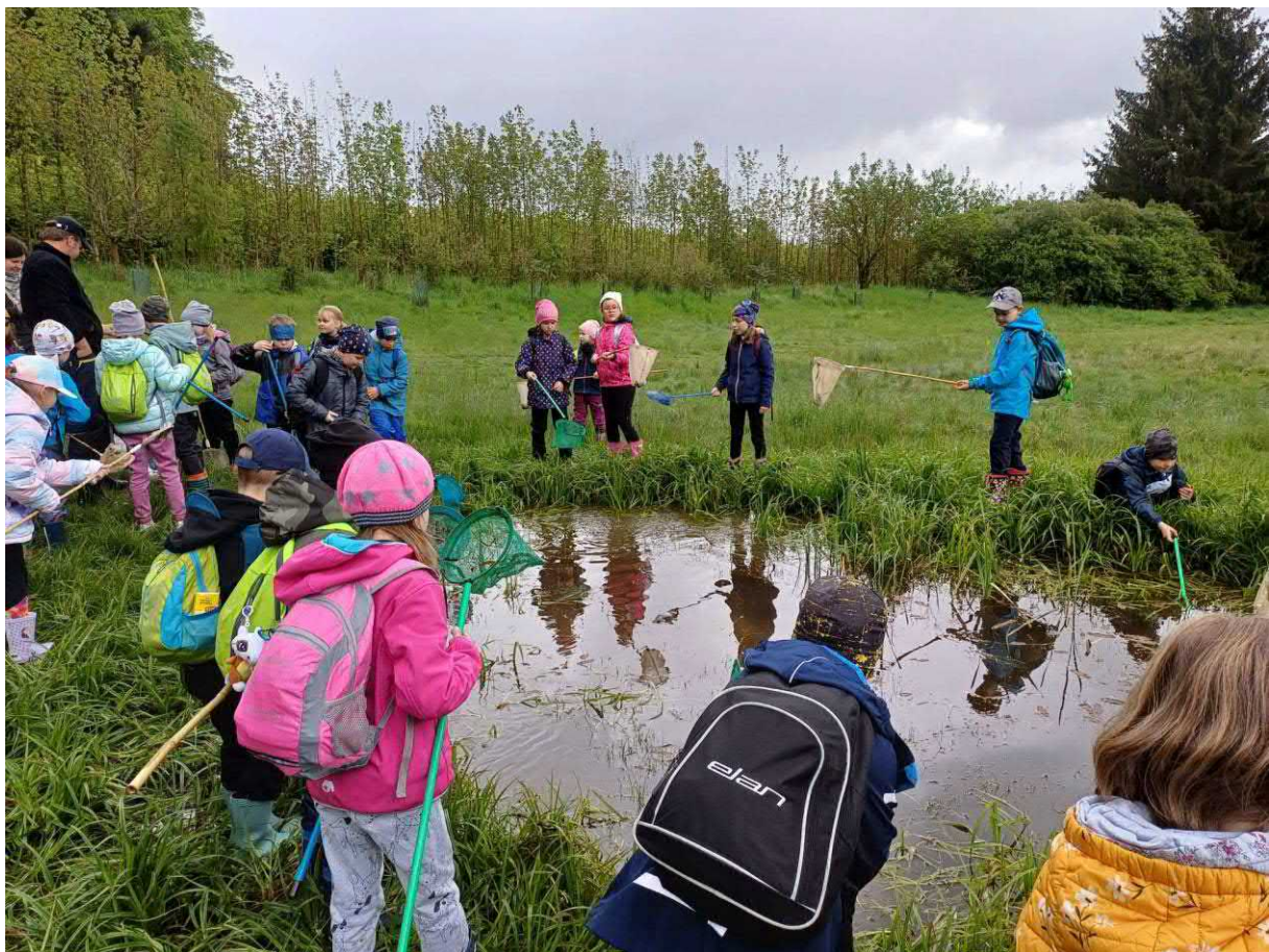
Projektový den Mokřady 1.C